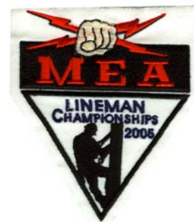
24) LxH 8.8x10.7(3.4x2.8)