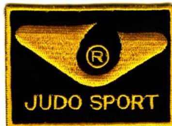
20) LxH 6.5x4.7(2.6x1.9)