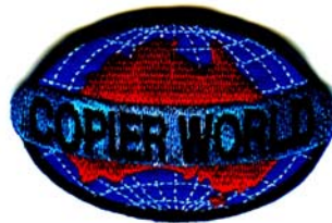
18) LxH 7.6x3.6(3x1.4)