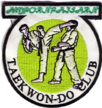
2) LxH 7.4x7.8(2.9x3)