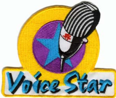
14) LxH 7x9(2.8x3.5)