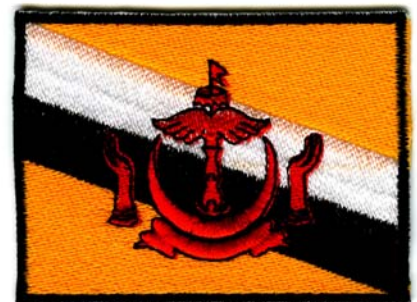
22) LxH 8x6(3.1x2.4)