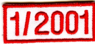
12) LxH 5.2x2.2(2x0.9)