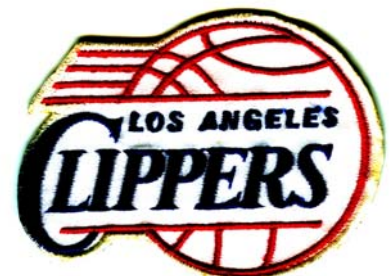
10) LxH 7.4x6(2.9x2.4)