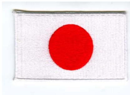
5) LxH 8x5(3.1x2),LxH7.8x4.8(3x1.9)