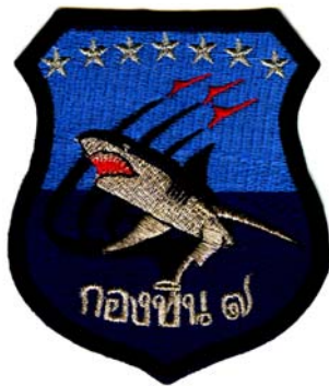
26) LxH 8x10(3.1x3.9)