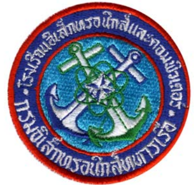
19) LxH 7.3x7.3(2.9x2.9)