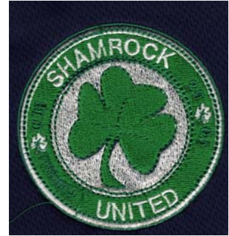
27) LxH 7.8x7.8(3x3)