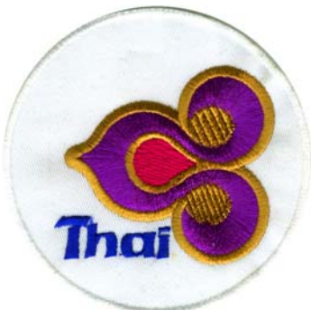
8) LxH 8x8(3.1x3.1)