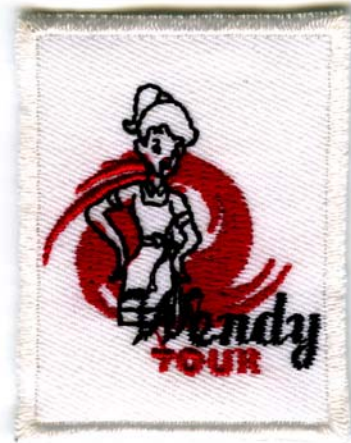
15) LxH 4.2x5.5(1.7x2.2)