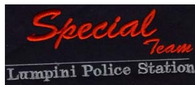
23) LxH 13x9(5.1x3.5)