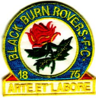
11) LxH 6.8x7(2.7x2.8)