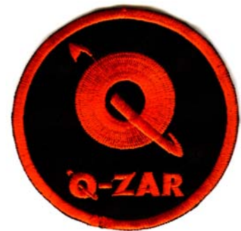
21) LxH 7.5x7.5(3x3)