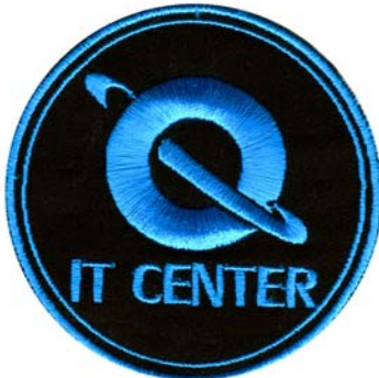
29) LxH 7.9x7.7(3.1x3)