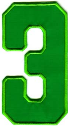
28) LxH 14x7.5(5.5x3)