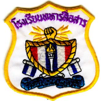
4) LxH 6.7x7(2.63x2.75)