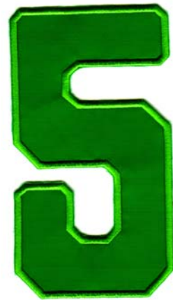
30) LxH 7.6x14(3x5.5)