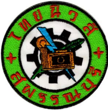
17) LxH 7.5x7.6(3x3)