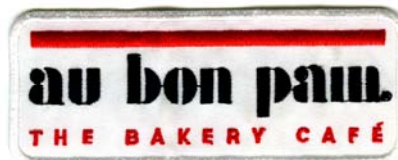
9) LxH 13x5(5.1x2)