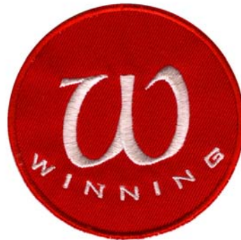
27) LxH 7.4x7.4(2.9x2.9)