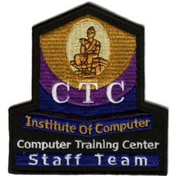
28) LxH 9.9x10.1(3.9x3.9)