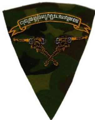
32) LxH 11.3x14.8(4.4x5.8) Sawn on directly on fabric