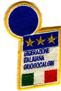
25) LxH 4.5x7.5(1.8x3)