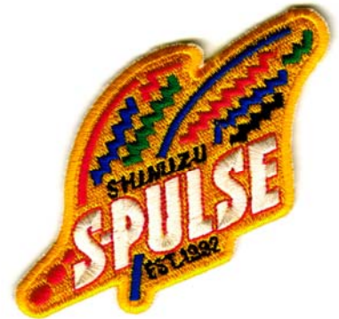
16) LxH 10x5.7(3.9x2.2)