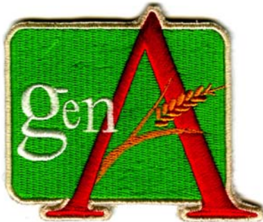
20) LxH 7.4x6.5(2.9x2.6)