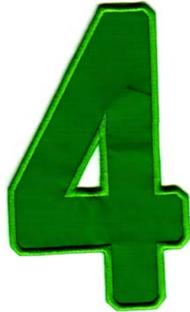
29) LxH 8.3x14(3.2x5.5)