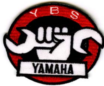
24) LxH 7x5.8(2.8x2.2)