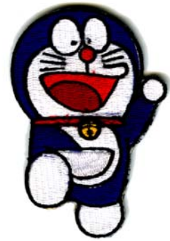
13) LxH 5x7.5(2x3)